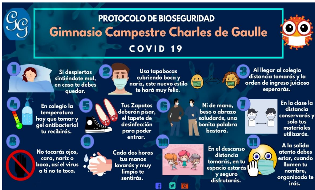
Resumen didáctico del protocolo de bioseguridad para los estudiantes al ingreso del colegio.